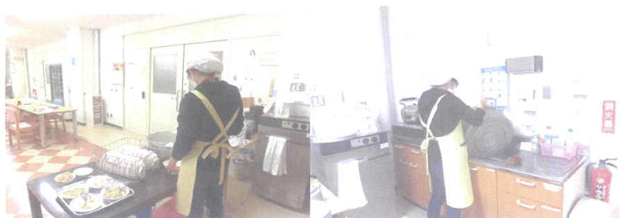
朝食 夕食の配膳作業