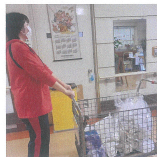
休日のごみ集め作業

☆アルバイトのお仕事風景☆ 先輩方も利用者の皆さんと楽しく会話しながら働いています！元気とやる気のある学生さんをお待ちしています！！